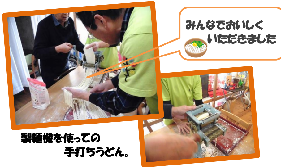
製麺機を使っての 手打ちうどん。

NPO法人 きんしゃい 株式会社 きんしゃい 連絡先 〒812-0053 福岡市東区箱崎 1-29-4 TEL 092-643-6095 http://www.npo-kinshai.com