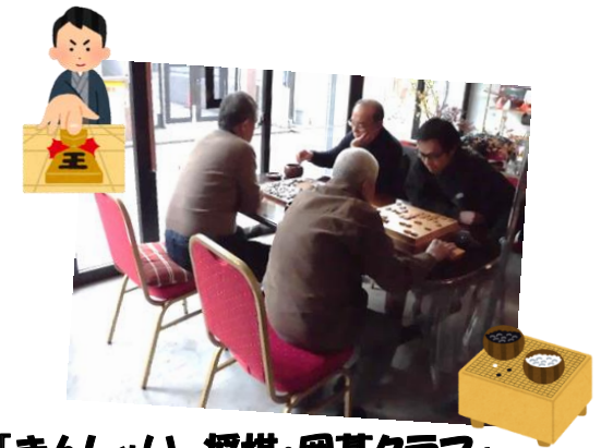
「きんしゃい 将棋・囲碁クラブ」 皆さん、真剣に対局中 時間も忘れちゃいます…。