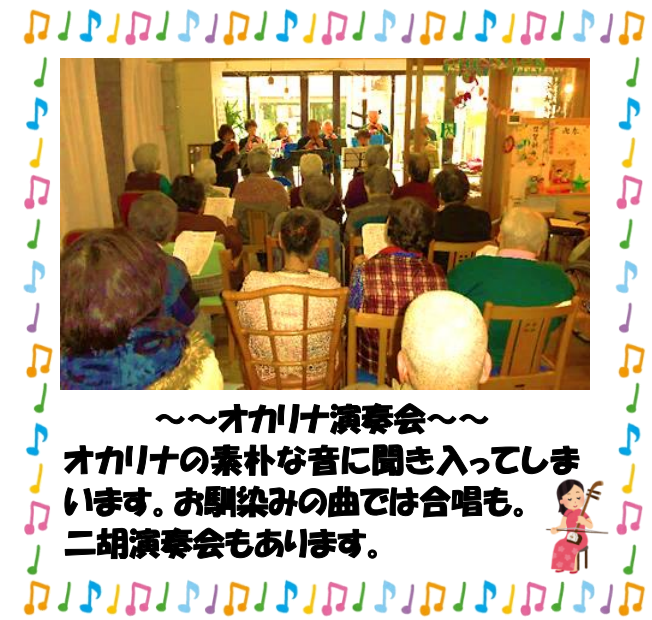
～オカリナ演奏会～ オカリナの素朴な音に聞き入ってしま います。お馴染みの曲では合唱も。 二胡演奏会もあります。