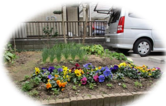
花も咲いて、春らしくなってきました。 もうすぐチューリップが見頃です。