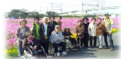
《久原かかしまつり》