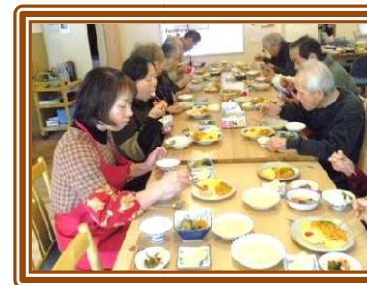
《手作りごはん・大好評!》