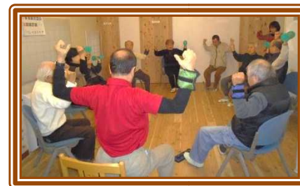
《健康体操、はりきってます》